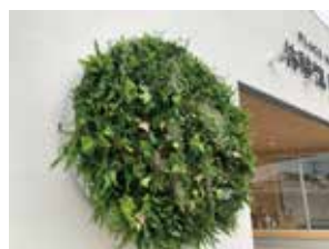
脱炭素社会へのチャレンジ宣言 壁面緑化