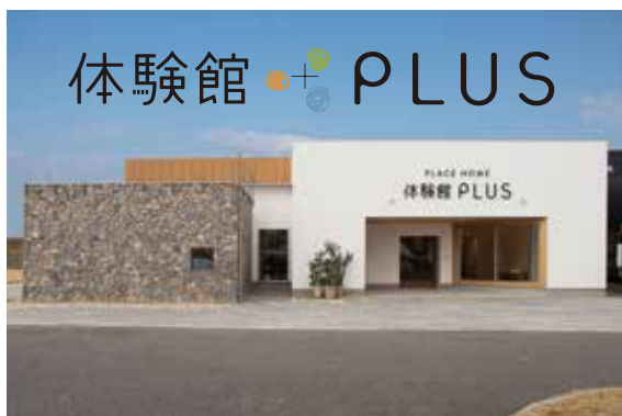
さまざまな自然素材で構成された外観