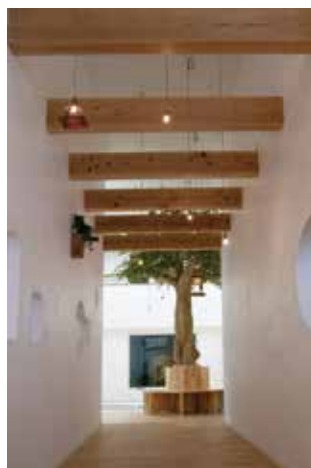
森の広場に立つシンボルツリー