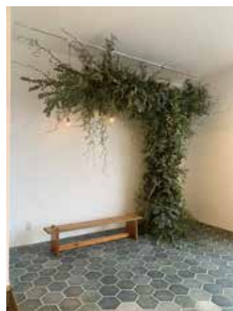
入口の一角は森の湖の水面を表現し 足元にタイルを一枚一枚貼った