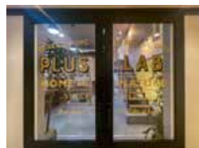
弊社独自開発のNEZ工法や 気密断熱性能研究所