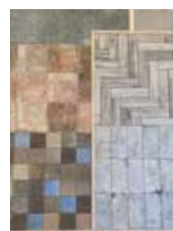
床材の現物を貼り 見て触ることも出来る